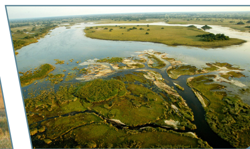
Botswana, il Delta dell'Okavango

Partenze giornaliere da Milano e Roma con voli Ethiopian Airlines via Addis Abeba