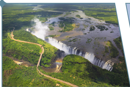
Zimbabwe, Cascate Vittoria