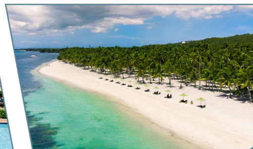
Bohol, Oceanica Resort Panglao

Partenze giornaliere da Milano e Roma con voli diretti Korean Air,