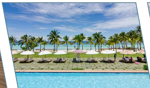
Bohol Beach Club