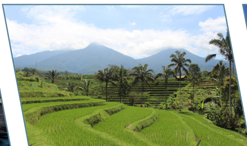
Le risaie di Jatiluwih