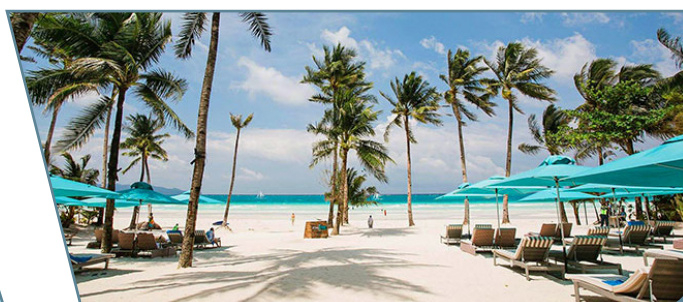
The Lind Boracay

Partenze da Milano, Venezia, Bologna e Roma con voli Qatar Airways via Doha