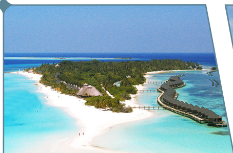
Kuredu Resort & Spa