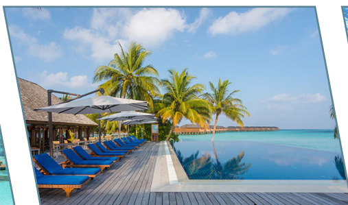
Vilamendhoo Island Resort & Spa,