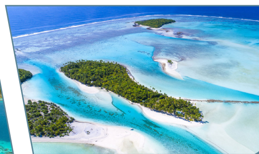
Laguna di Aitutaki, Isole Cook

Partenze da Milano e Roma con voli Air Tahiti Nui/Ita/Air Rarotonga