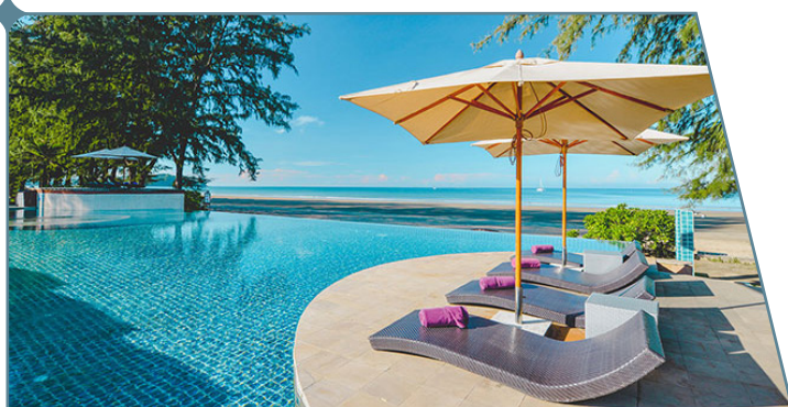
Twin Lotus Resort & Spa