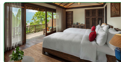
Lantan Mountain Bungalow

Partenze da Milano, Venezia e Roma con voli Qatar Airways via Doha