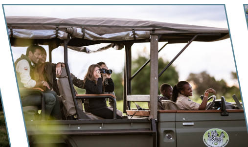
Fotosafari nelle Grumeti Hills