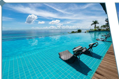
Cebu, The Reef Island Resort