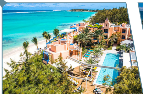
Salt of Palmar