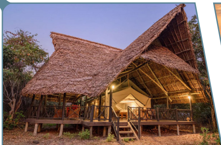
Rufiji River Camp