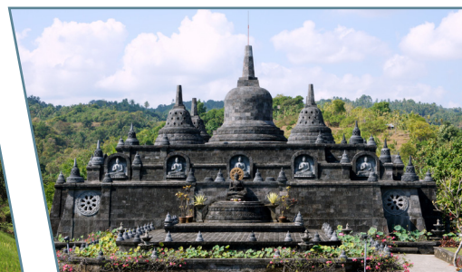
Bali, Bhrama Vihara Arama