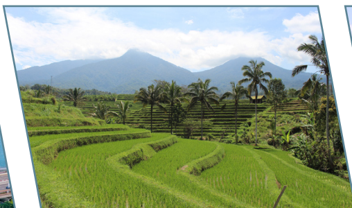
Bali, Le risaie di Jatiluwih