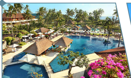
Bali, Nusa Dua Beach Hotel & Spa