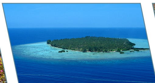
Kura Kura Resort