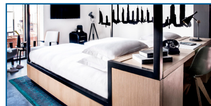
Canopy by Hilton Al Seef