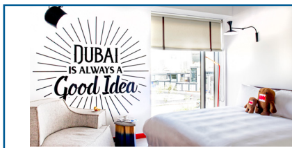
Hampton by Hilton Al Seef