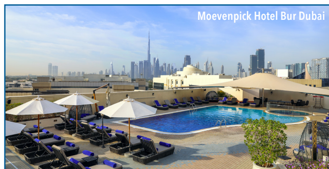
Moevenpick Hotel Bur Dubai