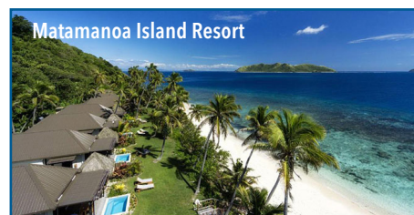
Matamanoa Island Resort

Partenze giornaliere da Milano, Venezia, Roma e Napoli con voli Emirates/Qantas/Fiji Airways da Pisa, Olbia e Catania con voli flydubai in classe economica Sistemazione in camera doppia, in solo pernottamento in Australia, con prima colazione a Matamanoa Trasferimenti alle Fiji - Escursioni con guida in inglese - Voli domestici Supplemento alta stagione su richiesta Set da viaggio Mappamondo - Quota individuale di gestione prenotazione Euro 90 Assicurazione MAPPAMONDO SUPERTOP annullamento/interruzione viaggio/ritardo aereo/medico/bagaglio da Euro 200