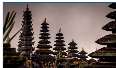
Besakih, il Tempio Madre