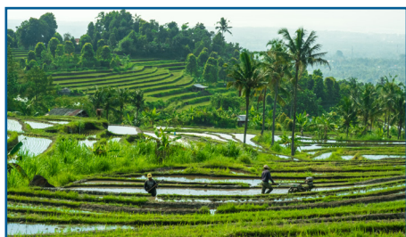
Le risaie a terrazza di Ubud