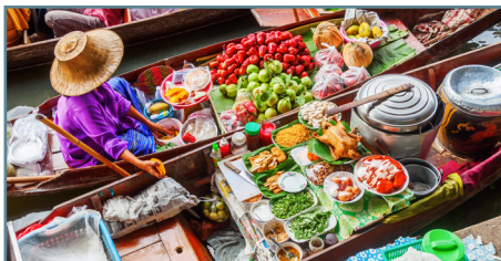
Il mercato galleggiante di Damnoensaduak