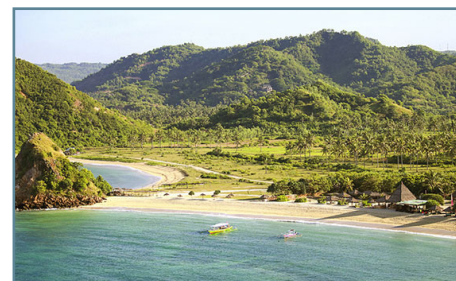
La spiaggia del Novotel Lombok Resort & Villas