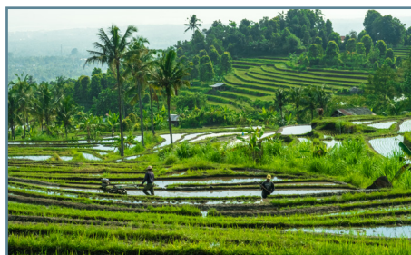
Le risaie di Jatiluwih