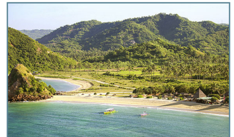
La spiaggia del Novotel Lombok Resort & Villas

Partenze con voli Emirates via Dubai Sistemazione in camera doppia con prima colazione, mezza pensione a pranzo durante il tour Trasferimenti - Traghetto veloce Bali > Lombok - Volo Lombok > Bali