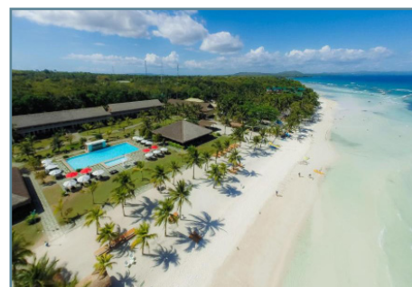
Bohol Beach Club

Partenze da Milano e Roma con voli diretti Korean Air