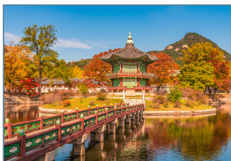
Seoul, Gyeongbokgung Palace

POSSIBILITÀ DI ESTENDERE IL VIAGGIO IN COREA DEL SUD CON UN TOUR IN ITALIANO, PARTENZE GARANTITE, O CON UN SOGGIORNO LIBERO