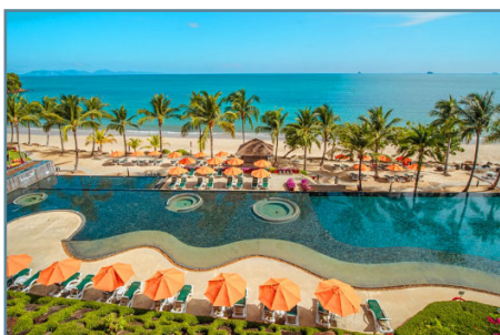
La piscina del Beyond Resort Krabi