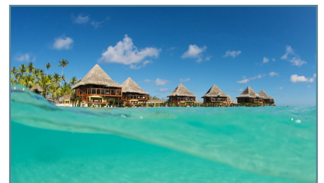
Rangiroa, Kia Ora Resort & Spa

Partenze giornaliere da Milano e Roma con voli Air Tahiti Nui/ITA Airways via Parigi