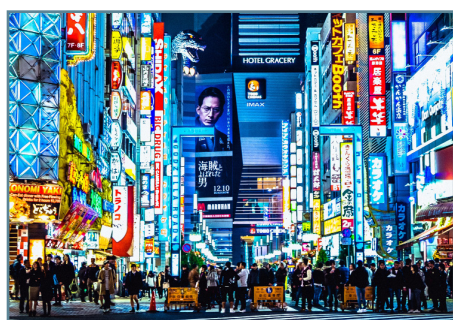
Tokyo, Shibuya Crossing