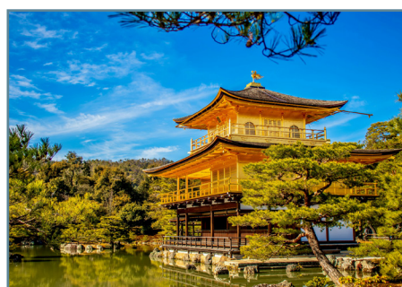
Kyoto, il tempio Kinkaku-ji