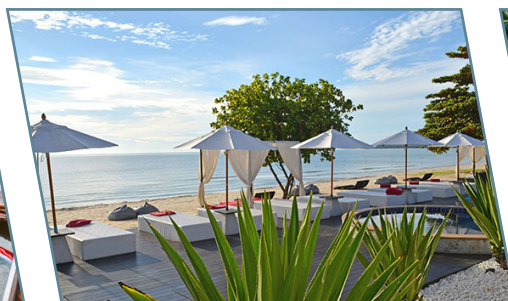
Khnaom, Aava Resort & Spa