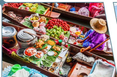
Il mercato galleggiante di Damnoensaduak