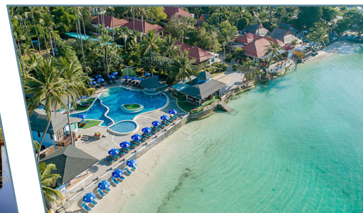
Chaba Cabana Beach Resort

Partenze da Torino con voli Turkish Airlines via Istanbul