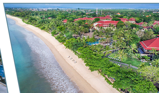
InterContinental Bali Resort

Partenze da Torino con voli Turkish Airlines via Istanbul