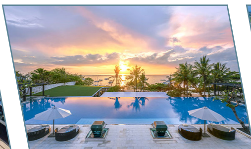
InterContinental Bali Sanur Resort