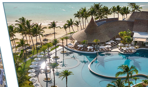
LUX* Belle Mare

Partenze da Milano, Venezia, Bologna e Roma con voli Emirates via Dubai