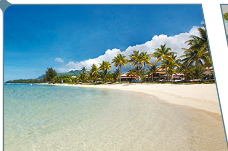
La spiaggia del Tamassa Bel Ombre