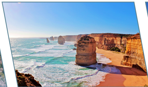
Australia, i Dodici Apostoli al tramonto