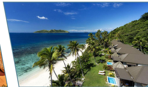
Fiji, Matamanoa Island Resort

Partenze giornaliere da Milano, Venezia, Bologna e Roma con voli Emirates/Qantas/Fiji Airways da Bergamo, Pisa, Napoli e Catania con voli flydubai in classe economica