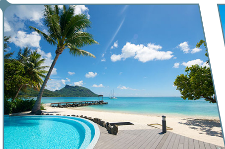
Huahine, Maitai Lapita Village