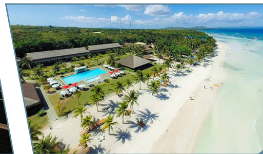
Bohol Beach Club

Partenze da Milano e Roma con voli diretti Korean Air Sistemazione in camera doppia con prima colazione Seoul/Cebu/Seoul con voli diretti Korean Air Trasferimenti Cebu/Bohol/Cebu in auto e barca veloce Quota individuale di gestione prenotazione Euro 90 - Set da viaggio Mappamondo Assicurazione MAPPAMONDO SUPERTOP annullamento/interruzione viaggio/ritardo aereo/medico/bagaglio da Euro 110