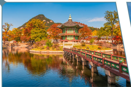
Seoul, Gyeongbokgung Palace

POSSIBILITÀ DI ESTENDERE IL VIAGGIO IN COREA DEL SUD CON UN TOUR IN ITALIANO O CON UN SOGGIORNO LIBERO