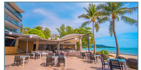
@Beach Bar & Restaurant

Partenze ogni giovedì da Napoli con voli flydubai via Dubai