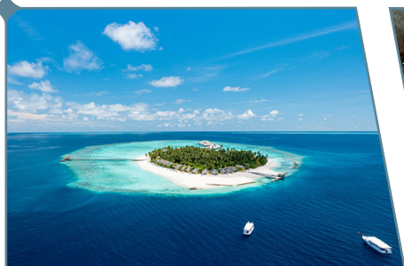
Atollo di Dhaalu

SUPPLEMENTO YQ/YR INCLUSO! Tasse biglietteria aerea Euro 100 ca.