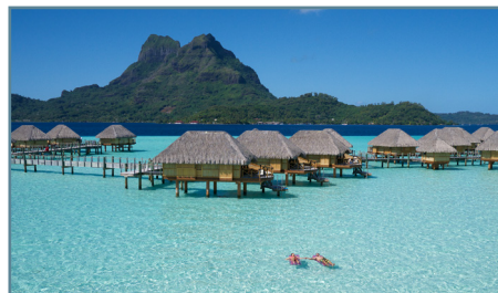
Bora Bora, Le Bora Bora by Pearl Resorts