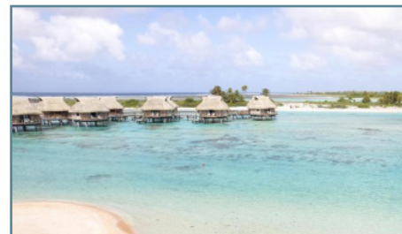
Tikehau, Le Tikehau by Pearl Resorts

Partenze giornaliere da Milano e Roma con voli Air Tahiti Nui/ITA Airways via Parigi