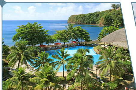
Le Tahiti by Pearl Resorts