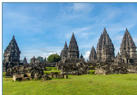
Yogyakarta, il tempio di Prambanan