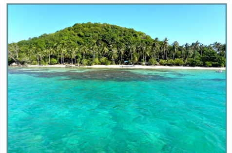
Kura Kura Resort Island, Arcipelago di Karimunjawa

Partenze da Milano e Roma con voli Emirates via Dubai