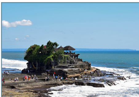
Bali, il tempio Tanah Lot