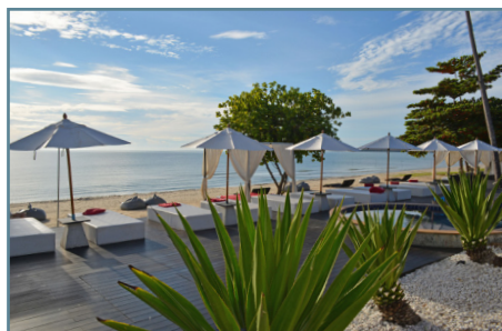
Khanom - Aava Resort & Spa