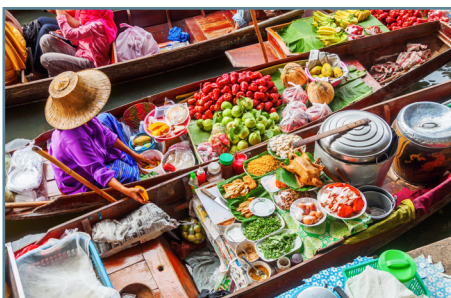
Il mercato galleggiante di Damnoensaduak