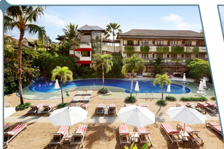
Blu-Zea Resort by Double-Six Luxury